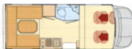
Davis 600 H 72.985,00 DM

Mit Erscheinen dieser Preisliste verlieren alle vorherigen ihre Gültigkeit. Ausgabe Sept. '97