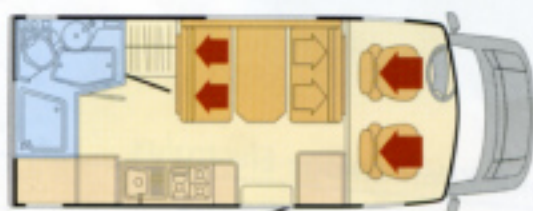
Bahia 635 SD