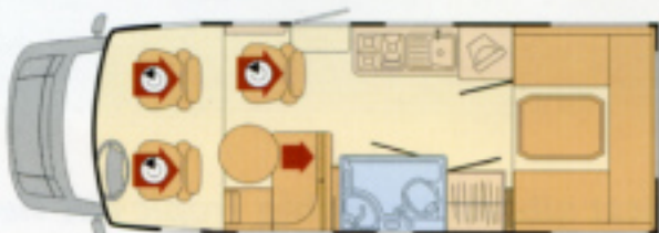
Bahia 700 H