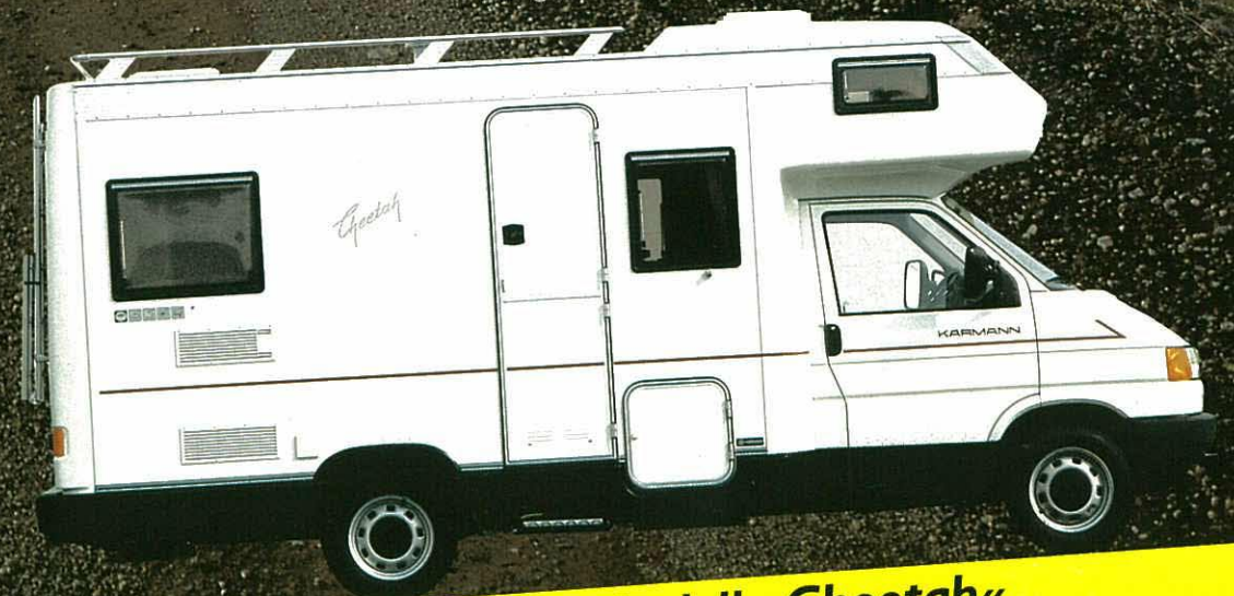
Karmann-Reisemobil Modell »Cheetah«.

Mit einem attraktiven Preis-/Leistungsverhältnis ist das Karmann-Reisemobil »Cheetah« das bewährte Modell in der Karmann-Wohnmobil-Familie. Der großzügig gestaltete, in der bekannten KARMANN-Qualität verarbeitete Wohnaufbau ist harmonisch auf das Fahrgestell abgestimmt. Er bietet zwei interessante Grundrißvarianten mit der Seiten- (»S«) oder auch mit der längs angeordneten »L«-Sitzgruppe. Ein technisch wie optisch ansprechendes Reisegefühl.