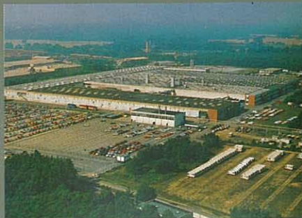
Karmann, Werk Rheine Karmann Brasilien