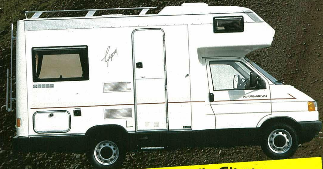
Karmann-Reisemobil Modell »Gipsy«.

Auf das ausgereifte Markenfahrzeug von VW hat KARMANN einen ebensolchen Wohnaufbau gesetzt. Solide in der Verarbeitung, überzeugend in der Gestaltung des Grundrisses präsentiert sich das Modell »Gipsy« in einer optisch rundum gelungenen Form.