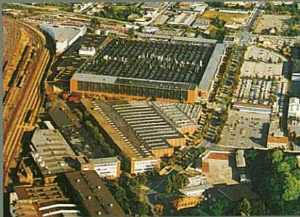
Karmann, Werk Osnabrück

Landschaften, so weit das Auge blicken kann, interessante Städte, die ihren eigentümlichen Flair bewahrt haben, und freundliche wie auch aufgeschlossene Menschen erwarten den Touristen.